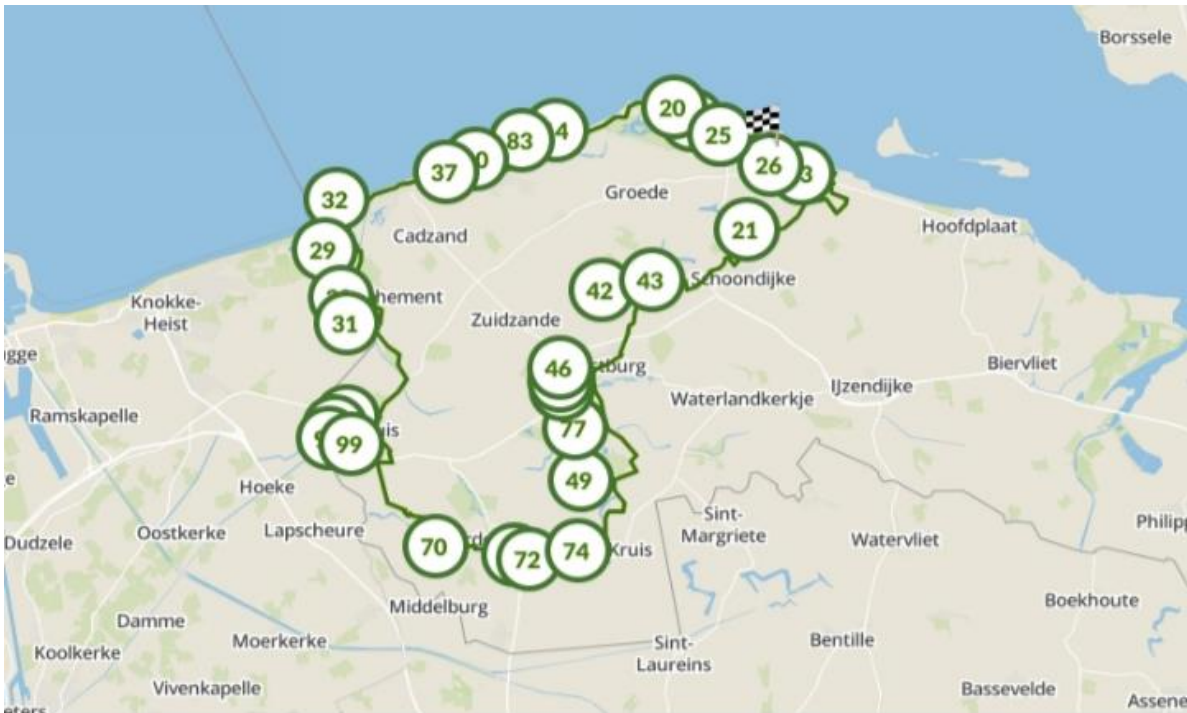
Fietsroute met verborgen plekjes in Zeeland (63.47 KM)

Start: Damse Vaart / Kaai Sluis (Parking St. Annastraat 15, 4524 JB Sluis)